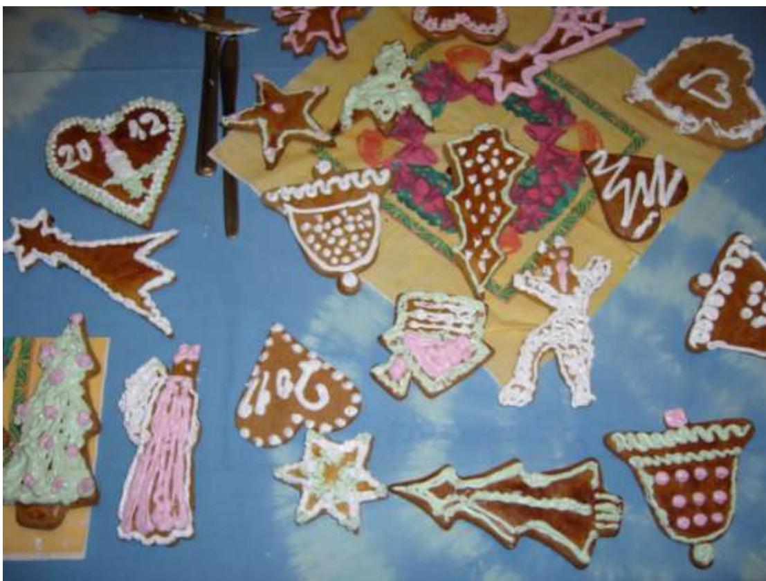
Vánoční besídka 8. 12. 2011 – předávání Certifikátu a dárku od sponzora