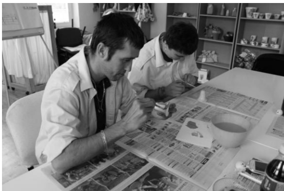
Andílci na výstavu ve fázi výroby...