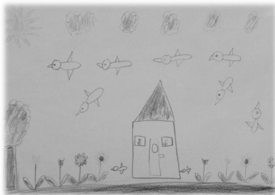
Obrázek namaloval M. P.